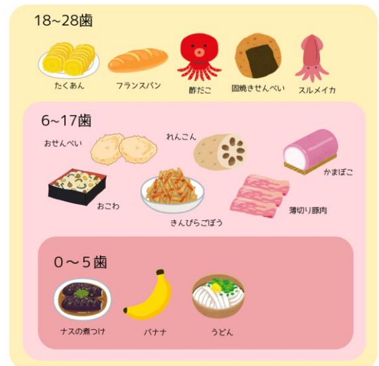
おいしく食べられる歯の本数